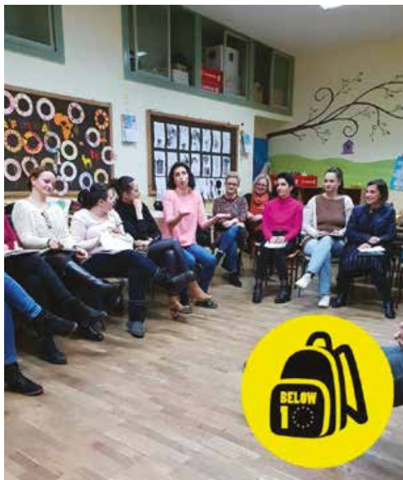
L'école pour les parents, Osijek (Feb, 2019)

laire est certainement une bonne méthode pour commencer l'inclusion des jeunes à risque et devrait être vu comme une activité de démarrage pour un processus d'inclusion complète aux cours réguliers et la réconciliation dans le système scolaire.