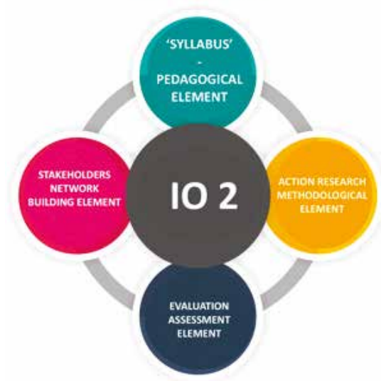
Fig. 1 I02 Eléments.