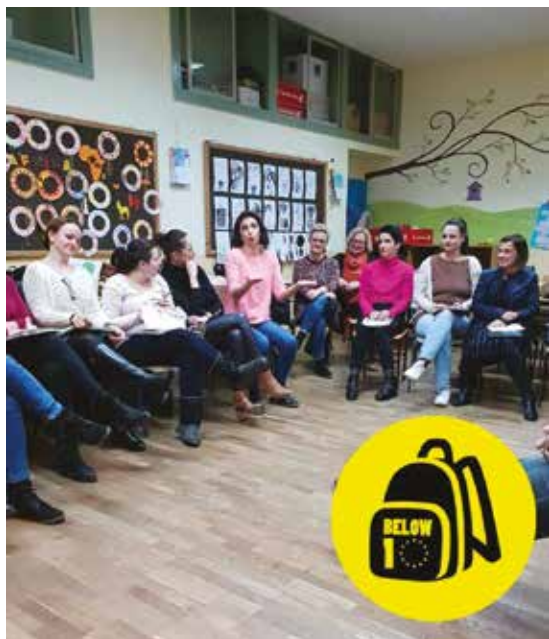
Škola za roditelje, Osijek (veljača, 2019)

ština za primanje i davanje informacija što je bilo teško za postići; loša internetska veza također može biti dodatno otežavajuća okolnost. Svejedno, e-učenje kao alat za sprječavanje ranog napuštanja školovanja je zasigurno dobra metoda za početak uključivanja mladih koji su u riziku od ranog napuštanja škole te se treba smatrati početnom aktivnosti za potpuno uključivanje u normalnu nastavu i školski sustav.