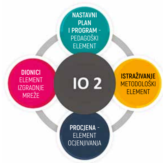
Slika 1, IO2 elementi